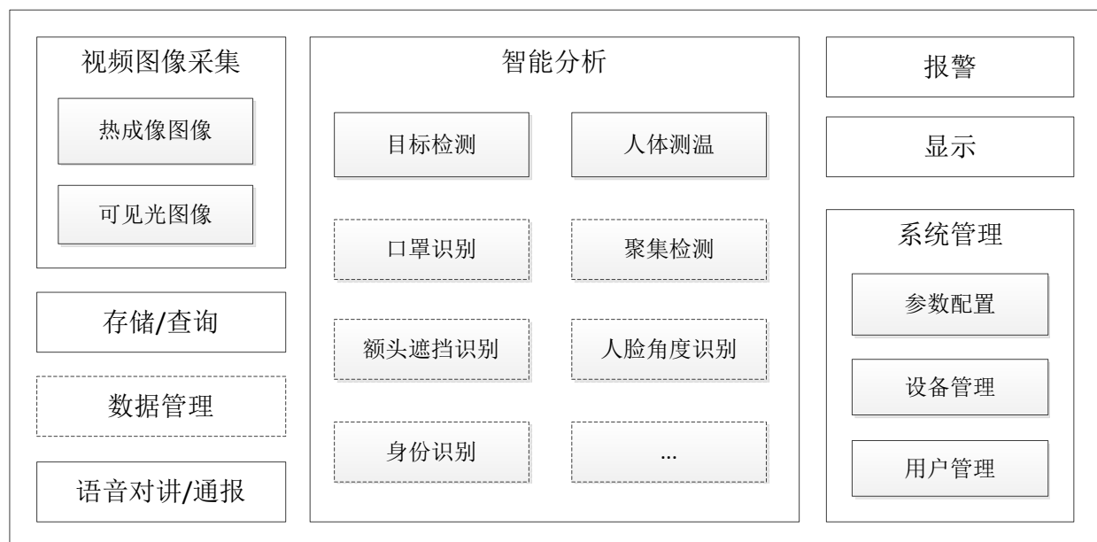
图2 热成像人体测温报警系统功能组成图

热成像人体测温报警系统的功能包括视频图像采集、智能检测识别、报警、存储/查询、显示、数据统计分析、系统管理及语音对讲/通报等组成，如图2所示。